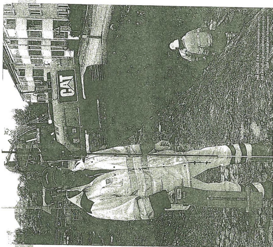
MÅ MELDE FRA: Oslo kommune har (no) ditt tenk på graveplan (tjeneste for alle som skal grave i kommunen).

– Dette er pliktig foreløpig i Oslo, men kan også komme til å omfatte flere kom-muner. Nettportalen inneholder en kart-