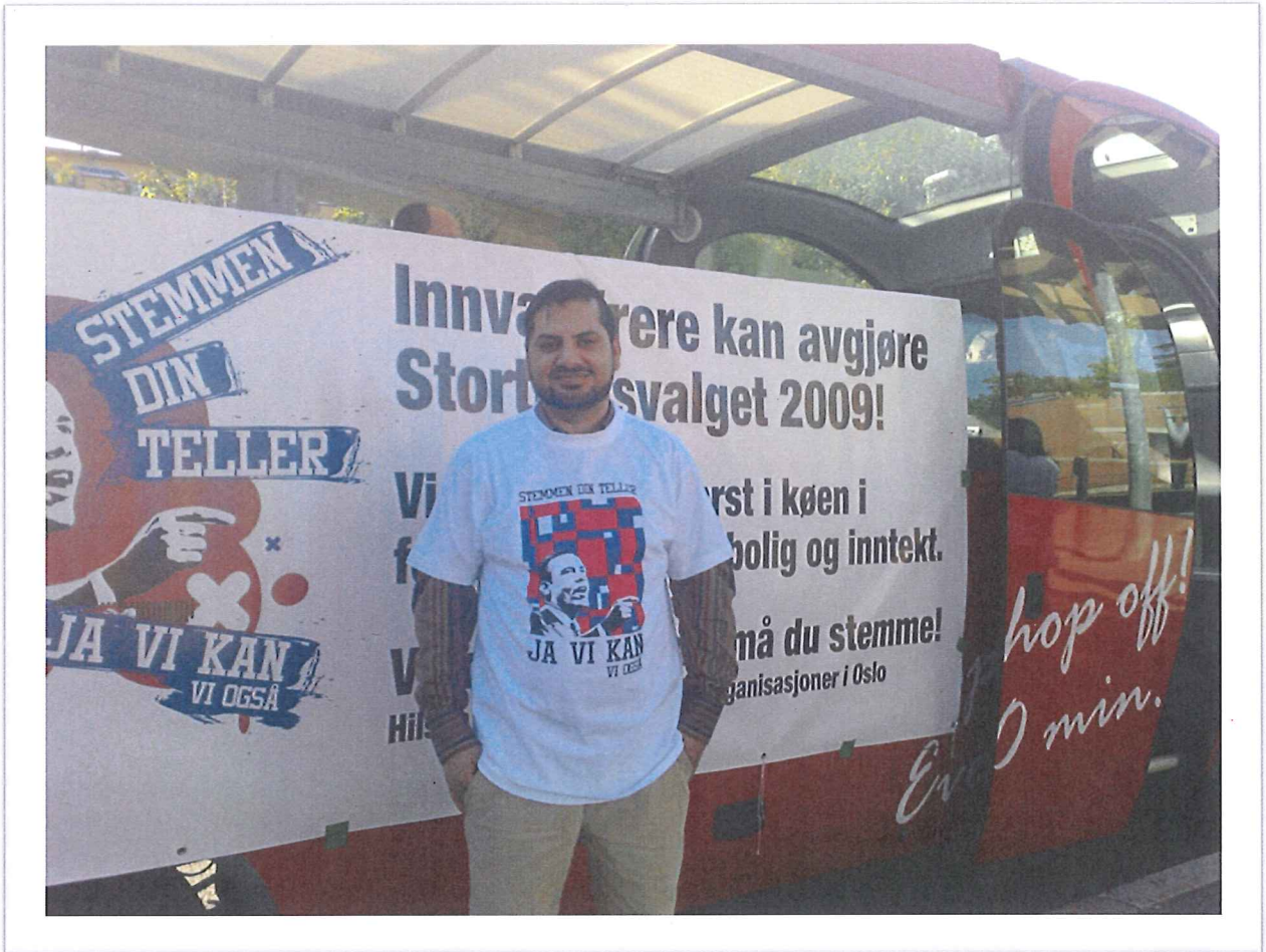
Mangfoldsutvalget deltar i mobiliseringskampanje før valget i 2009 og 2011 for å styrke innvandrerbefolkningens valgdeltakelse