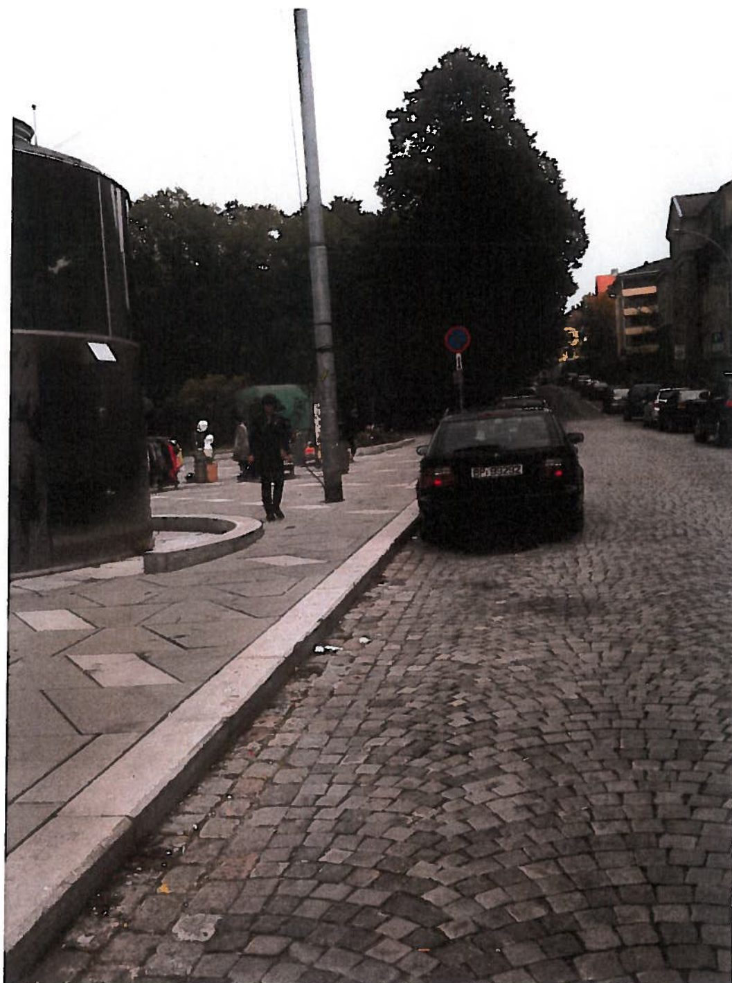
Geitmyrsveien bak Mix kiosken