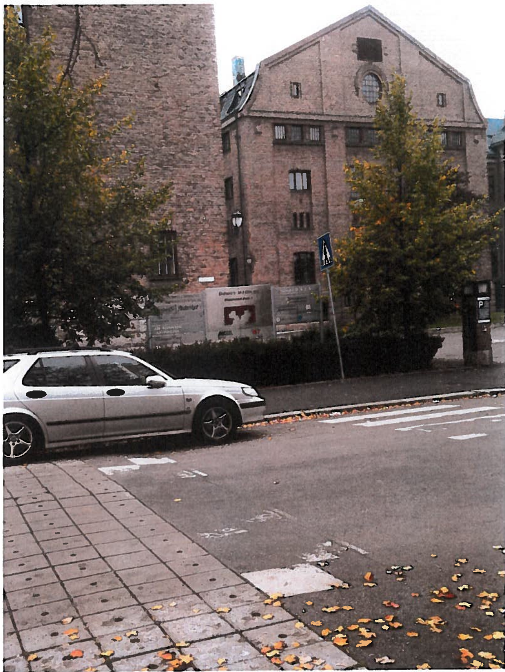
Stensberggaten utenfor Pilestredet Park 7