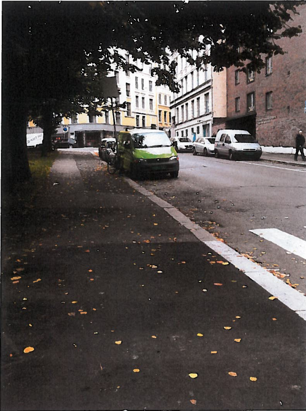
Dalsbergstien 18 mot parken, utenfor Bislett fysikalske