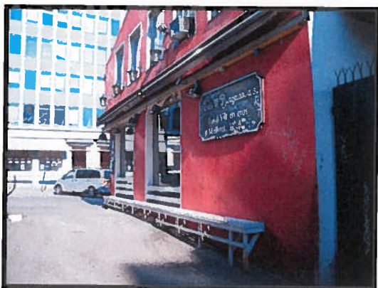
Uteservering langs fasaden.

Revolver ligger i et bebodd, sentrumsnært område med adresse Møllergata 32 . Virksomheten har fasade ut mot Møllergata og mot St. Edmunds kirke i Møllergata 30 (den engelske kirken). Det er gjennomgang fra Møllergata til Mariboos gate, men den private passasjen er stengt med port der bygningen slutter. Bakgården har inngang fra port ved siden av den etablerte uteserveringen.