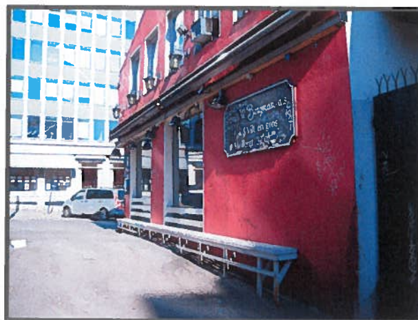
Mot Møllergata (uteservering)

Det har tidligere vært mange klager fra beboerne i nærmiljøet på uro, støy, hærverk, fyll og bråk i Møllergata og omliggende gater nattetid. Beboerne knyttet klagen til at skjenketidene i området ikke tok hensyn til at Møllergata, med sidegater, er et bebodd område med mange småbarnsfamilier. Klagerne anførte at praksisen med lange åpnings- og skjenketider ga helsemessige konsekvenser, blant annet som utrygghet for å gå hjem sent på kvelden, avbrutt nattesøvn, mangel på ro og hvile i eget hjem. Det ble knyttet særlig bekymring til at barna som bor i området utsettes for uheldige påvirkninger i sitt oppvekstmiljø. Det ble tatt hensyn til disse klagen da Revolver ikke fikk innvilget sin søknad om utvidede åpnings- og skjenketider ute, både langs fasade og i bakgård i Byrådssak 1126/10, vedtatt 09.12.2010.