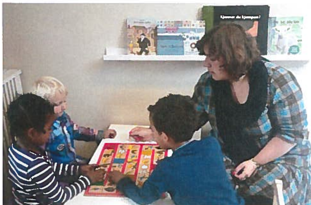
Følelsspillet er morsomt og spennende!

De voksne må introdusere, inspirere, lære barna å spille spill og gjerne være med selv.