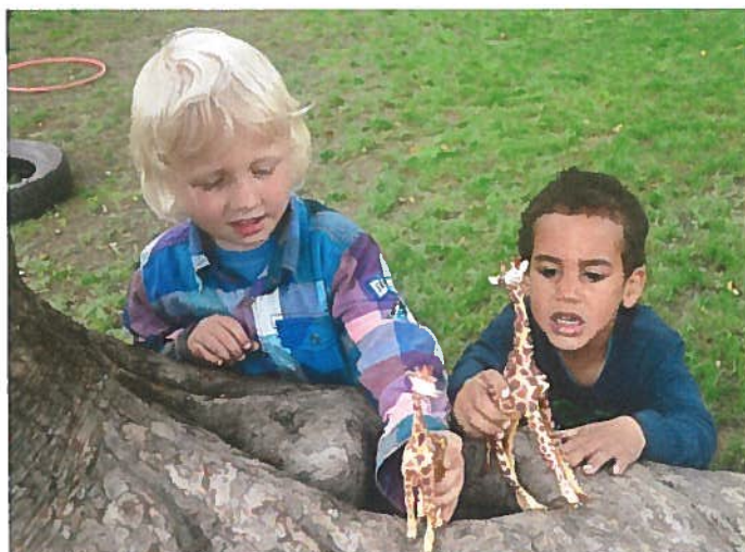
Hva snakker disse giraffene om?

Barns språkutvikling har en sentral plass i barnehagetradisjonen - kommunikasjon, språk og tekst er et av fagområdene det er formulert mål for i Rammeplan for barnehagenes innhold og oppgaver .