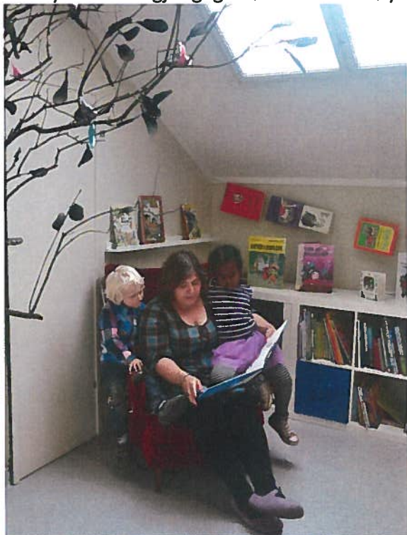
Barnehagens lesestue er et populært sted.

Bokhyllene med tilgjengelige bøker i barnehøyde.