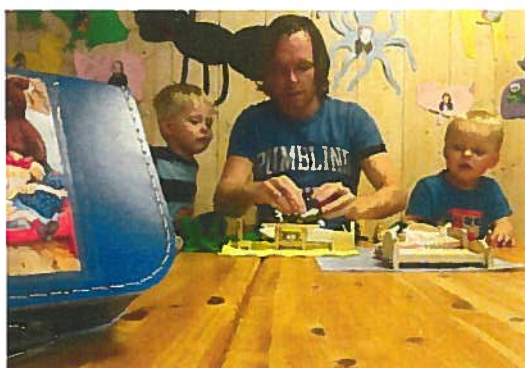
"Gullhår smakte på grøten i den store bollen."

For å visualisere og konkretisere litteratur må det brukes konkrete og gjerne dramatisering.