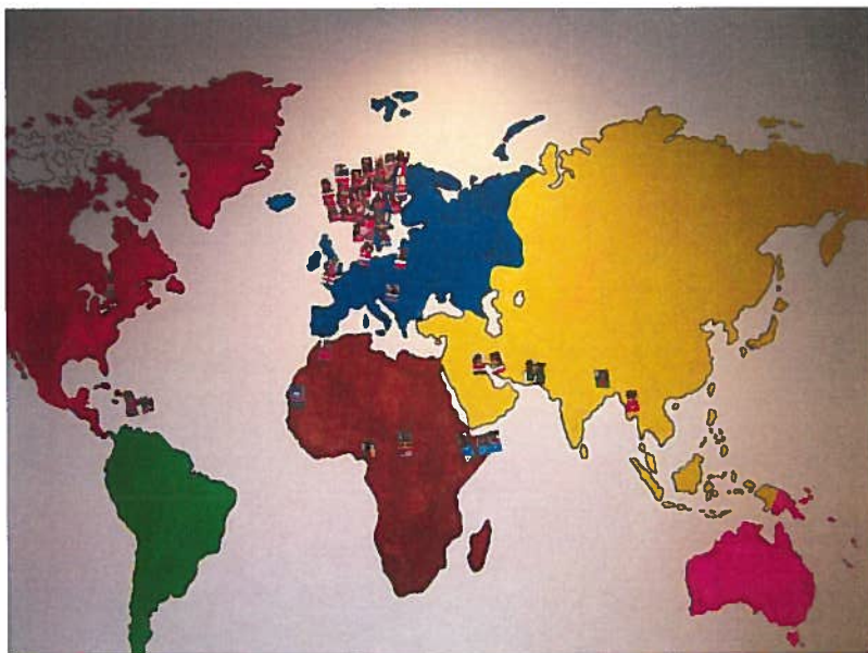
Vi har barn fra mange land!

En rekke barn i vår bydel har et annet morsmål enn norsk og lærer norsk som andrespråk i barnehagen. Noen barn har stor språkkompetanse både på morsmål og på norsk, mens andre har et godt utviklet morsmål og et mindre utviklet andrespråk (norsk) når de begynner i barnehagen.