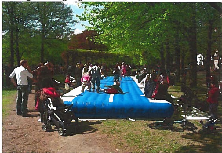
Hopp & lek i parken 2009 Arr Sagene IF og Sagene samfunnshus