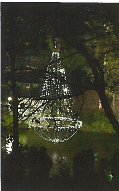
Elvelangs i fakkellys 2005, vis a vis Lilleborg ↙ Bjølsenfestivalen (tidligere Bekkerock) 2009 ↘