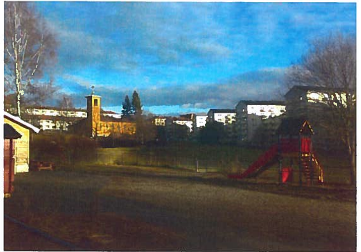
Barneparken i Iladalen