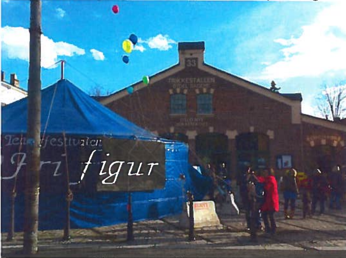
Figurfestival Trikkestallen 2010 Arr.: Unima, Oslo Nye Teater, Riksteatret & Bydel Sagene