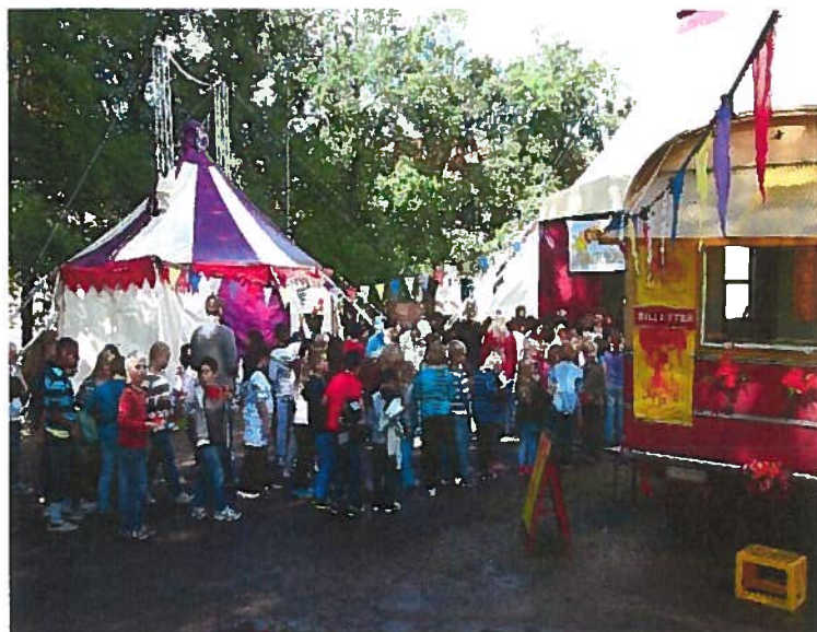
Sirkuslandsbyen, Torshovparken 2012 Arr.: Cirkus Xanti