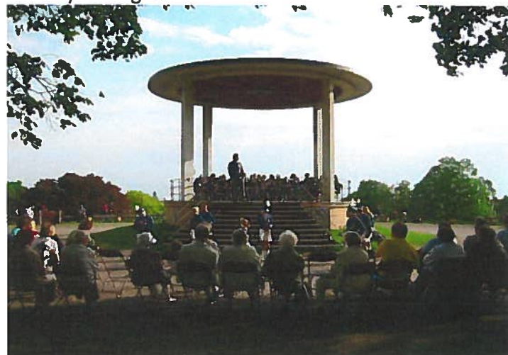
Paviljongkonsert slutten av 90-tallet Arr.: Bydel Sagene