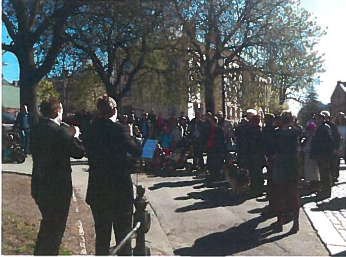
1.maifeiring ved Beierbrua 2012