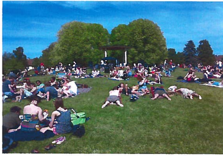
Rekreasjon, Torshovparken 2010