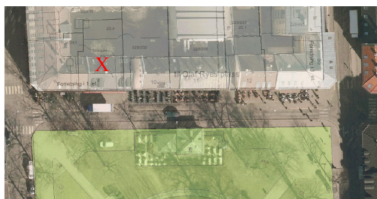
Reguleringskart (Plan- og bygningsetaten).

For virksomheter som benytter lyd- og musikkanlegg, henviser bydelsoverlegen til veilederen Musikkanlegg og helse - veileder til arrangører og kommuner , kapittel 8 - Regelverket om høy lyd og punktene 8.1.1 og 8.1.2. Ved eventuelle klager og støy, vil bydelsoverlegen legge særlig vekt på berørte naboers behov for tilfredsstillende lydforhold ved arbeid, søvn, hvile og rekreasjon.