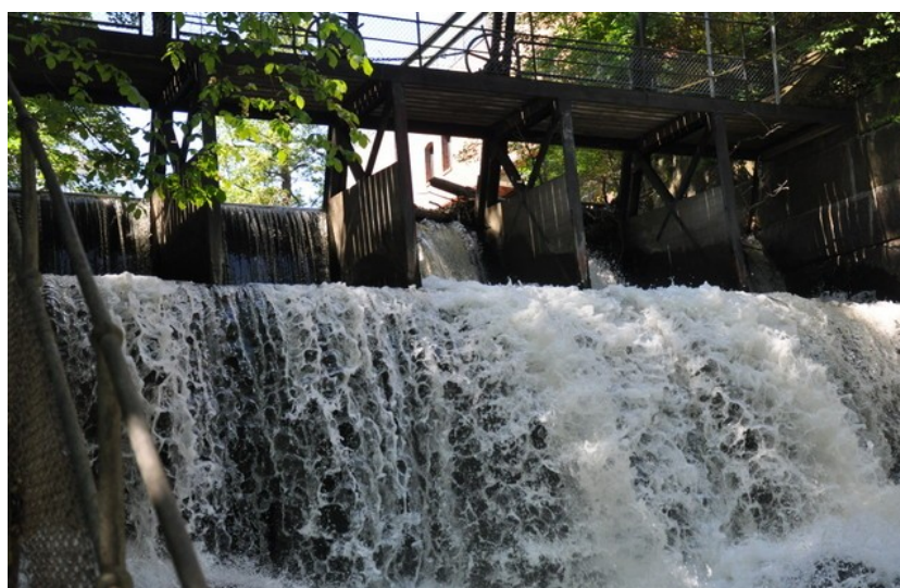
De færreste har sett «Lille Niagara»