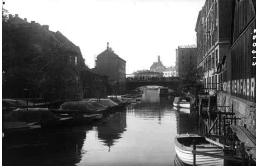
Akerselva hadde stor båttrafikk for hundre år siden.