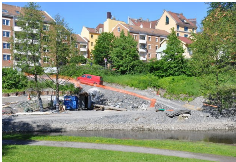
Her er det plass til et lite «Toscana» langs elvebredden.

På nedre Grünerløkka rett nord for Ankerbrua og vis à vis DogA, er det langs elvas østlige bredd en skråning som i dag ikke er i bruk. Området er på omlag 2,8 mål og er for bratt for ferdsel. Nå er området preget av anleggsarbeidet med Midgardsormen. Flere har tatt til orde for å utvikle dette området og gjøre det tilgjengelig for de mange som bruker Akerselva til rekreasjon. Denne delen av Akerselva har i flere vært preget av narkosalg. Økt tilgjengelighet og mer folk vil bidra til mindre kriminalitet og større trygghet.