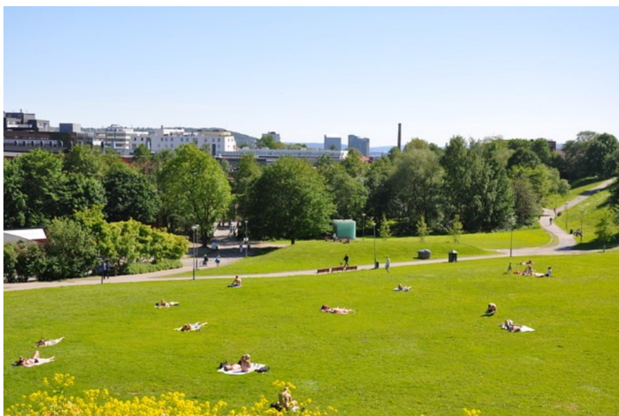
Myraløkka - med Akerselva og Myrens Verksted bak trærne i bakgrunnen.

Myraløkka er et 40 mål stort parkområde som ligger i en skålformet helling fra Maridalsveien i vest og Arendalsgata i nord ned mot Akerselva. Det skålformede terrenget ned mot elva stammer fra et teglverk som lå her, og som tok ut store mengder leire fra Myraløkka til bruk i produksjonen av teglstein. Teglverket som ble anlagt mellom 1820 og 1840, ble drevet til det ikke var mer leire igjen, rundt år 1900.