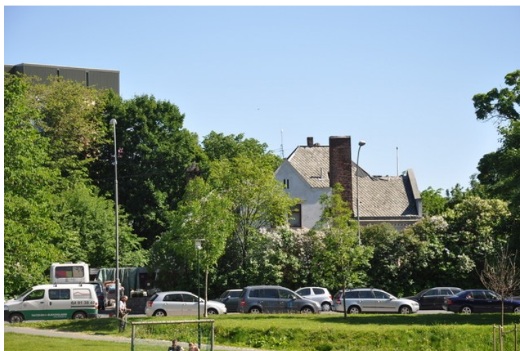
Den gamle direktørboligen