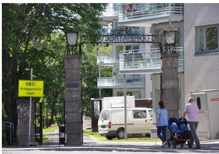
Bare den flott smijernsporten står igjen etter gjærfabrikken.

Den 17. juni åpnet Arbeidermuseet i Sagveien 28. I samarbeid med Norsk Teknisk Museum, Bydel Sagene og Arbeiderbevegelsens arkiv og bibliotek har Oslo Museum fått midler fra Kulturdepartementet til å formidle arbeider- og industrikultur langs Akerselva. Dette vil bidra til å ta vare på Akerselvas spennende industrihistorie. Fra juli 2013 kommer Akerselva digital – en audioguide som kan spilles på mobilen, og som dekker hele elveløpet..