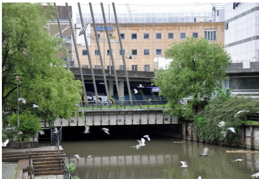
På Vaterland forsvinner Akerselva under Galleri Oslo.

I tillegg er det viktig å bedre belysningen langs elva på Vaterland.