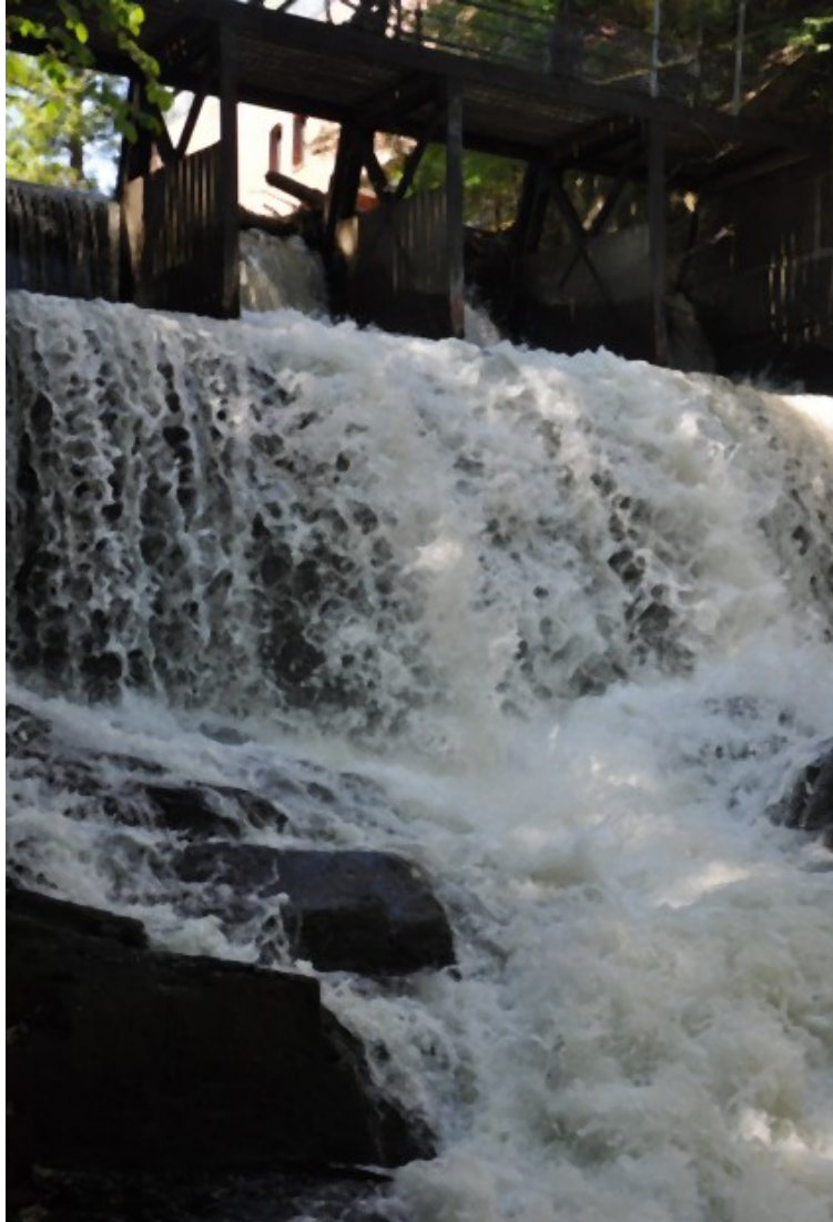
"Lille Niagara" - Akerselvas skjulte perle - må fram i lyset