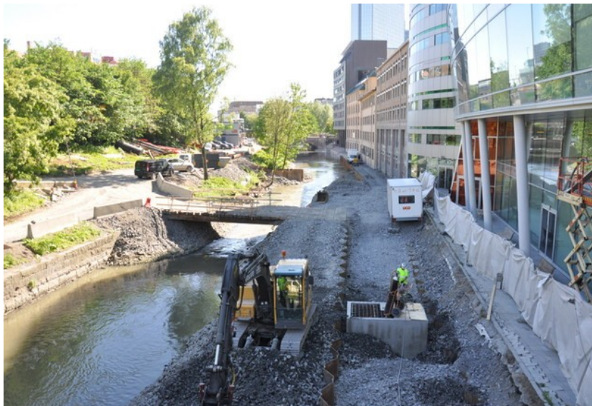
Det er plass til en gangvei på vestsida av elva etter at Midgardsormen er gravd ned. Bildet er tatt fra Hausmanns bru mot Vaterland.

I forbindelse med anleggsarbeidet med Midgardsormen vurderte Bymiljøetaten å etablere en ny gangvei på på Akerselvas vestsida på strekningen mellom Vaterlandsparken og Nybrua. Samtidig ble det foreslått å bygge tre nye gangbruer på den samme strekningen. Byutviklingskomiteen i Grünerløkka bydel stilte seg positive til forslagene. Også Akerselva Næringsforening gikk sterkt inn for dette. Men i byrådet ble forslagene lagt på is.