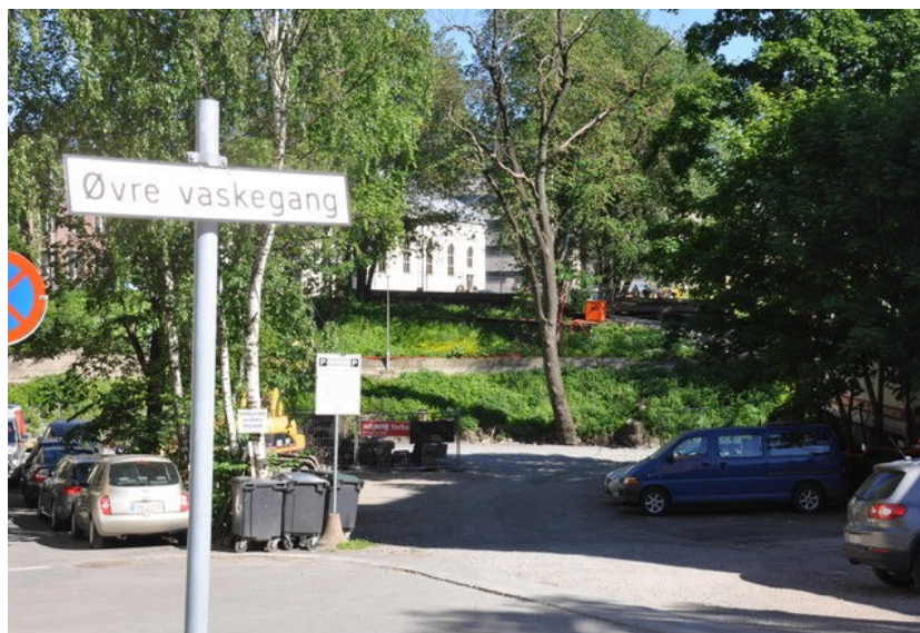
Øvre vaskegang ender i en parkeringsplass. Her bør det komme en ny gangbru over elva.