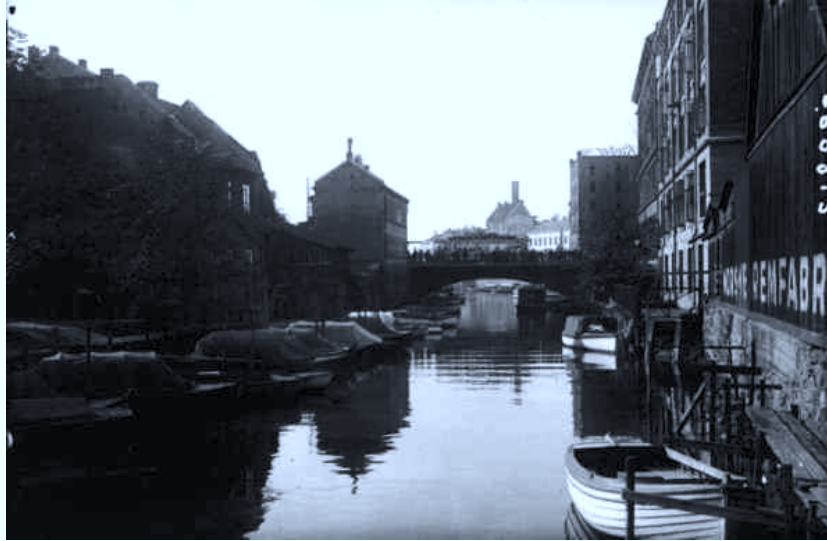
Akerselva hadde stor båttrafikk for hundre år siden.