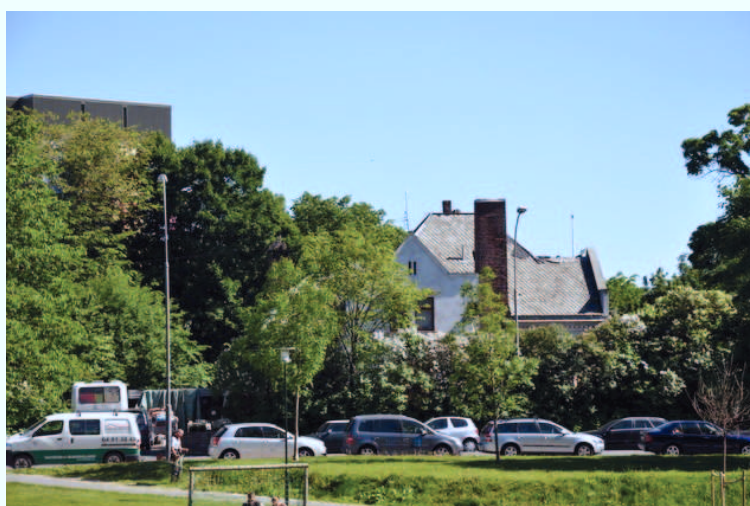
Den gamle direktørboligen