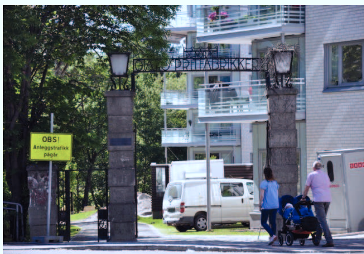
Bare den flott smijernsporten står igjen etter gjærfabrikken.

Den 17. juni åpnet Arbeidermuseet i Sagveien 28. I samarbeid med Norsk Teknisk Museum, Bydel Sagene og Arbeiderbevegelsens arkiv og bibliotek har Oslo Museum fått midler fra Kulturdepartementet til å formidle arbeider- og industrikultur langs Akerselva. Dette vil bidra til å ta vare på Akerselvas spennende industrihistorie. Fra juli 2013 kommer Akerselva digital – en audioguide som kan spilles på mobilen, og som dekker hele elveløpet..