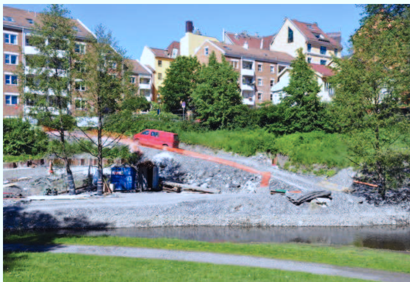
Her er det plass til et lite «Toscana» langs elvebredden.

På nedre Grünerløkka rett nord for Ankerbrua og vis à vis DogA, er det langs elvas østlige bredd en skråning som i dag ikke er i bruk. Området er på omlag 2,8 mål og er for bratt for ferdsel. Nå er området preget av anleggsarbeidet med Midgardsormen. Flere har tatt til orde for å utvikle dette området og gjøre det tilgjengelig for de mange som bruker Akerselva til rekreasjon. Denne delen av Akerselva har i flere vært preget av narkosalg. Økt tilgjengelighet og mer folk vil bidra til mindre kriminalitet og større trygghet.