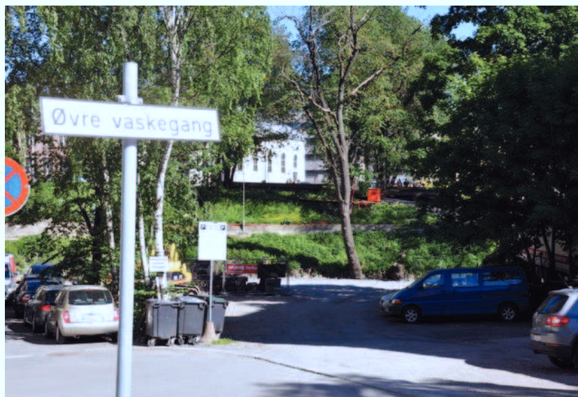
Øvre vaskegang ender i en parkeringsplass. Her bør det komme en ny gangbru over elva.