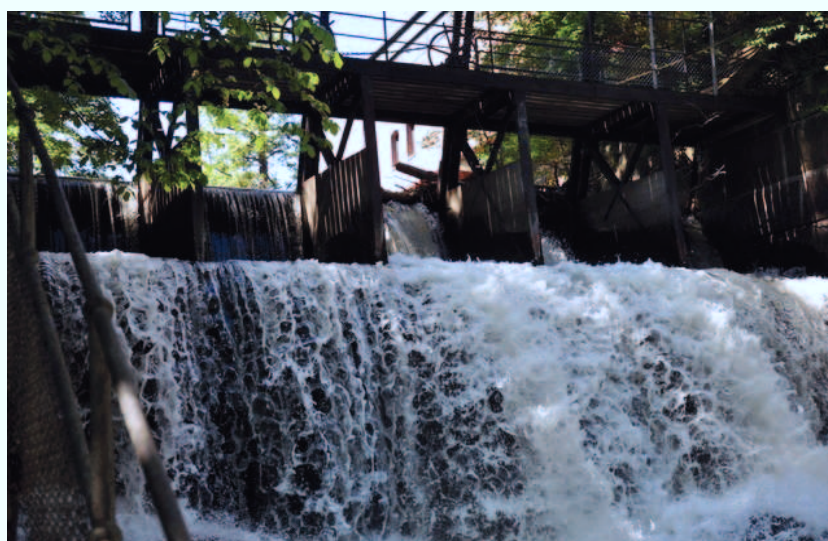
De færreste har sett «Lille Niagara»