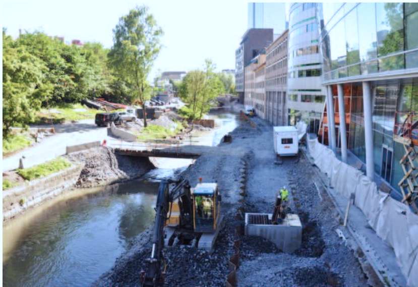
Det er plass til en gangvei på vestsida av elva etter at Midgardsormen er gravd ned. Bildet er tatt fra Hausmanns bru mot Vaterland.

I forbindelse med anleggsarbeidet med Midgardsormen vurderte Bymiljøetaten å etablere en ny gangvei på på Akerselvas vestsida på strekningen mellom Vaterlandsparken og Nybrua. Samtidig ble det foreslått å bygge tre nye gangbruer på den samme strekningen. Byutviklingskomiteen i Grünerløkka bydel stilte seg positive til forslagene. Også Akerselva Næringsforening gikk sterkt inn for dette. Men i byrådet ble forslagene lagt på is.