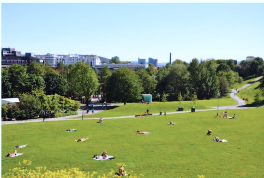
Myraløkka - med Akerselva og Myrens Verksted bak trærne i bakgrunnen.

Myraløkka er et 40 mål stort parkområde som ligger i en skålformet helling fra Maridalsveien i vest og Arendalsgata i nord ned mot Akerselva. Det skålformede terrenget ned mot elva stammer fra et teglverk som lå her, og som tok ut store mengder leire fra Myraløkka til bruk i produksjonen av teglstein. Teglverket som ble anlagt mellom 1820 og 1840, ble drevet til det ikke var mer leire igjen, rundt år 1900.