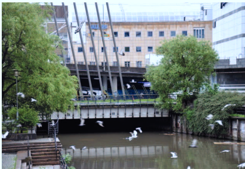
På Vaterland forsvinner Akerselva under Galleri Oslo.

I tillegg er det viktig å bedre belysningen langs elva på Vaterland.