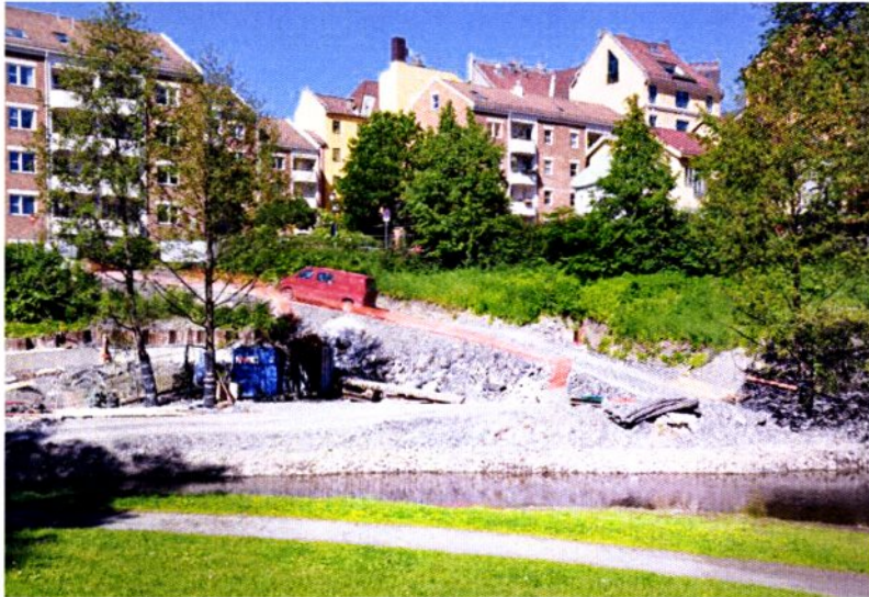
Her er det plass til et lite «Toscana» langs elvebredden.

På nedre Grünerløkka rett nord for Ankerbrua og vis à vis DogA, er det langs elvas østlige bredd en skråning som i dag ikke er i bruk. Området er på omlag 2,8 mål og er for bratt for ferdsel. Nå er området preget av anleggsarbeidet med Midgardsormen. Flere har tatt til orde for å utvikle dette området og gjøre det tilgjengelig for de mange som bruker Akerselva til rekreasjon. Denne delen av Akerselva har i flere vært preget av narkosalg. Økt tilgjengelighet og mer folk vil bidra til mindre kriminalitet og større trygghet.