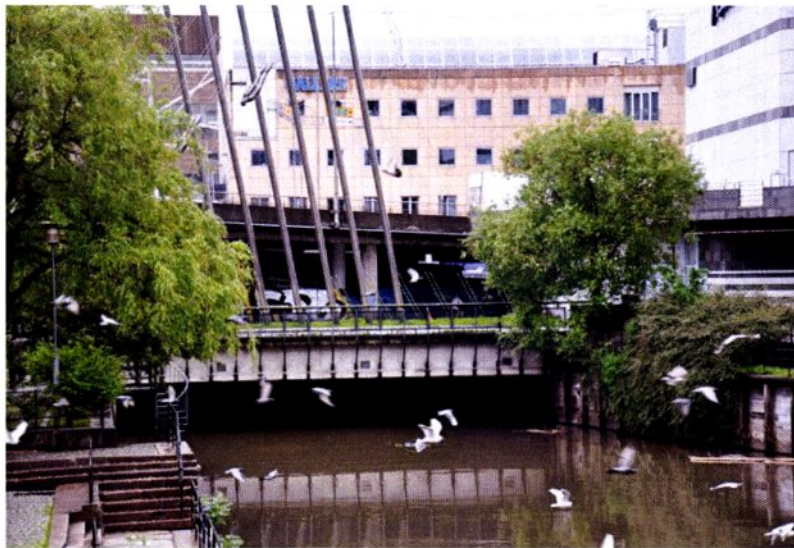
På Vaterland forsvinner Akerselva under Galleri Oslo.

I tillegg er det viktig å bedre belysningen langs elva på Vaterland.