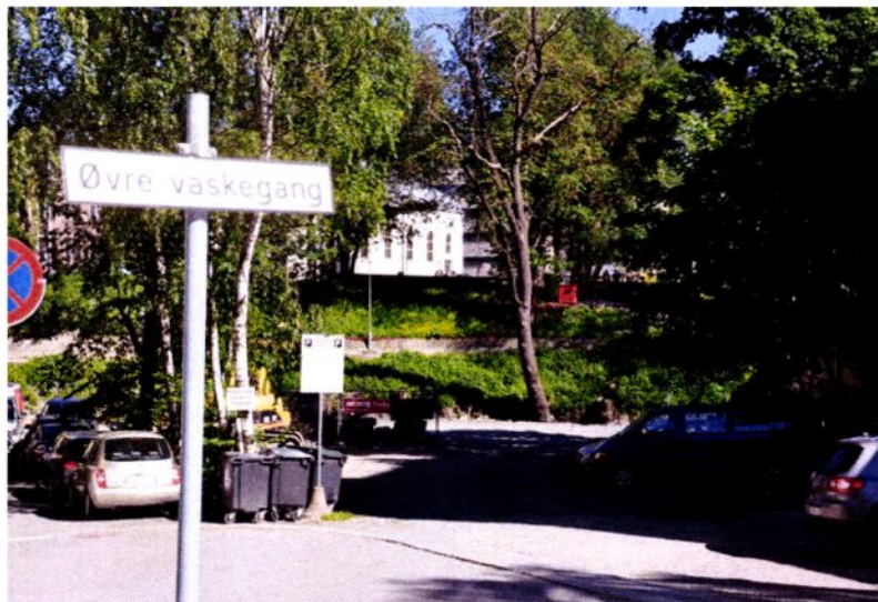
Øvre vaskegang ender i en parkeringsplass. Her bør det komme en ny gangbru over elva.