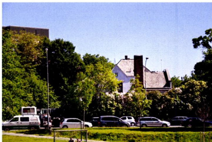
Den gamle direktørboligen