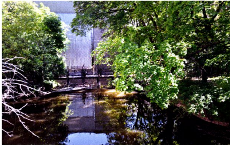
Få vet at Akerselvas største fossefall skjuler seg i bakgrunnen. Bildet er tatt fra Treschow bru.

Fossen, som også kalles Lille Niagara, er den største i Akerselva og har et fall på 16 meter. Fossen er dessverre gjerdet inn på Bjølsen Valsemøllens fabrikkområde, og er ukjent for folk flest. Nå er det på tide å bringe den fram i lyset og la turgåere langs elva nyte synet av elvas største fossefall.