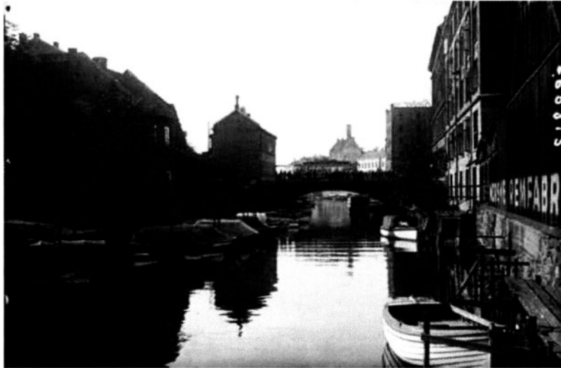
Akerselva hadde stor båttrafikk for hundre år siden.