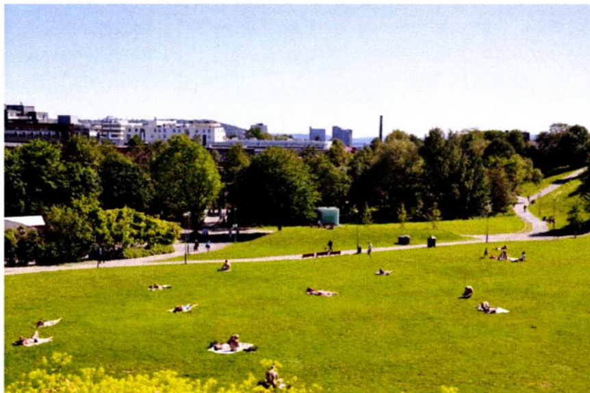
Myraløkka - med Akerselva og Myrens Verksted bak trærne i bakgrunnen.

Myraløkka er et 40 mål stort parkområde som ligger i en skålformet helling fra Maridalsveien i vest og Arendalsgata i nord ned mot Akerselva. Det skålformede terrenget ned mot elva stammer fra et teglverk som lå her, og som tok ut store mengder leire fra Myraløkka til bruk i produksjonen av teglstein. Teglverket som ble anlagt mellom 1820 og 1840, ble drevet til det ikke var mer leire igjen, rundt år 1900.