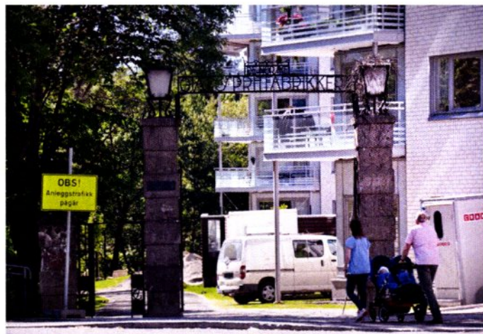
Bare den flott smijernsporten står igjen etter gjærfabrikken.

Den 17. juni åpnet Arbeidermuseet i Sagveien 28. I samarbeid med Norsk Teknisk Museum, Bydel Sagene og Arbeiderbevegelsens arkiv og bibliotek har Oslo Museum fått midler fra Kulturdepartementet til å formidle arbeider- og industrikultur langs Akerselva. Dette vil bidra til å ta vare på Akerselvas spennende industrihistorie. Fra juli 2013 kommer Akerselva digital – en audioguide som kan spilles på mobilen, og som dekker hele elveløpet..