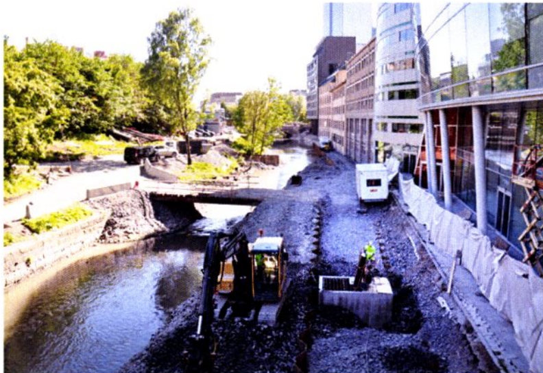
Det er plass til en gangvei på vestsida av elva etter at Midgardsormen er gravd ned. Bildet er tatt fra Hausmanns bru mot Vaterland.

I forbindelse med anleggsarbeidet med Midgardsormen vurderte Bymiljøetaten å etablere en ny gangvei på på Akerselvas vestsida på strekningen mellom Vaterlandsparken og Nybrua. Samtidig ble det foreslått å bygge tre nye gangbruer på den samme strekningen. Byutviklingskomiteen i Grünerløkka bydel stilte seg positive til forslagene. Også Akerselva Næringsforening gikk sterkt inn for dette. Men i byrådet ble forslagene lagt på is.