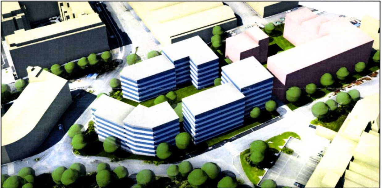
Planområdet sett fra sydøst

Eventuelle innspill eller spørsmål til planarbeidet kan innen tre uker rettes til: ARCASA arkitekter AS, Sagveien 23 C III, 0459 Oslo