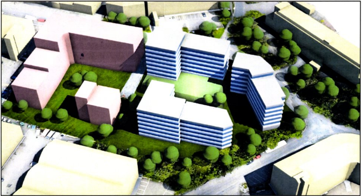
Planområdet sett fra vest