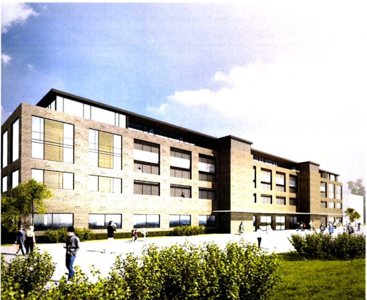
Planområdet sett fra nordøst

Eventuelle innspill eller spørsmål til planarbeidet kan innen tre uker rettes til: