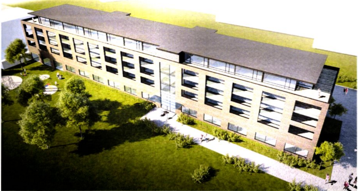
Planområdet sett fra sydøst