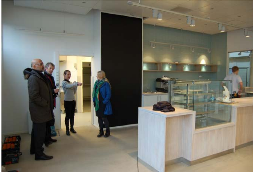
Foto fra befarings på Verdenshuset Haugenstua 27.11.2013