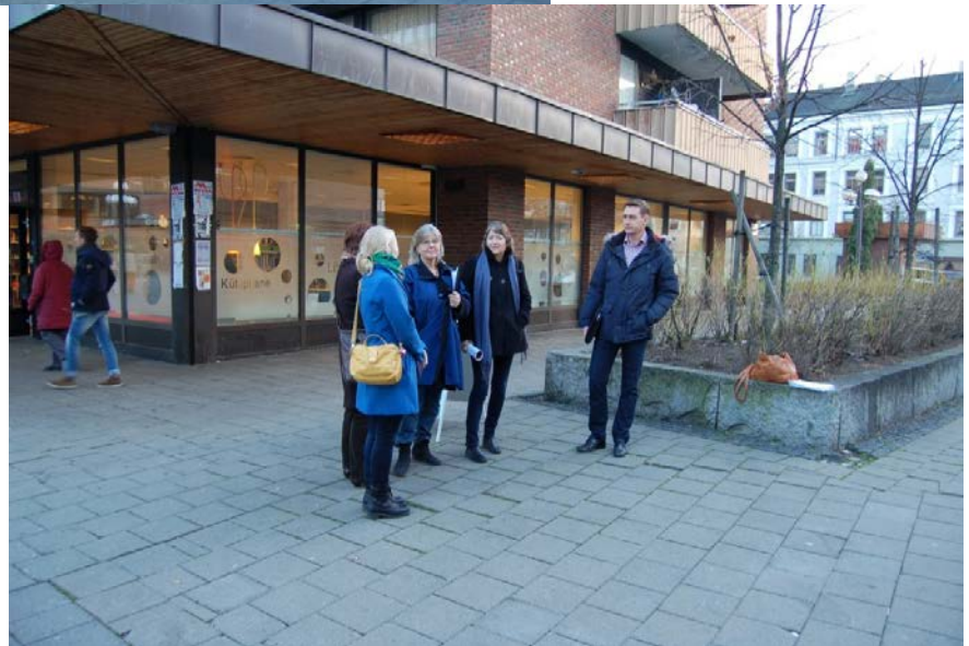
Foto: Befaring med biblioteket ved og i Postens lokaler 3.12.2013