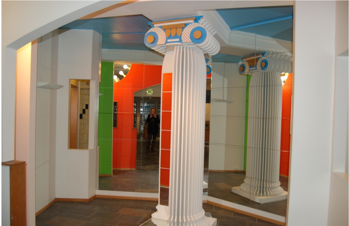
Foto av postmoderne interiører i 1 etg i Kolstadgata 1