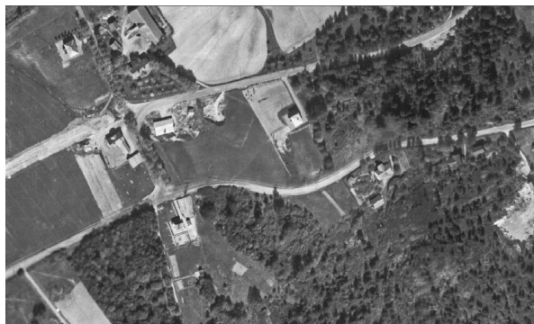
Flyfoto 1937 (Gamle Strømsvei midt i bildet)