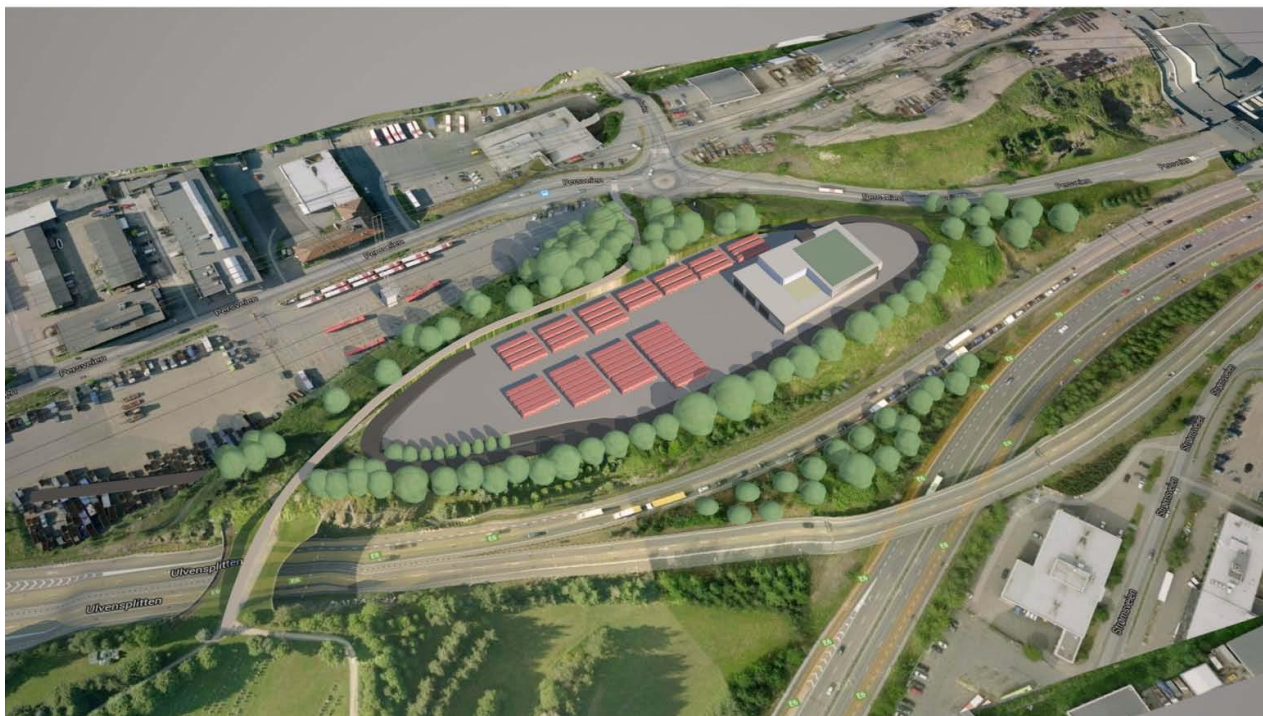
Perspektiv fra sørvest