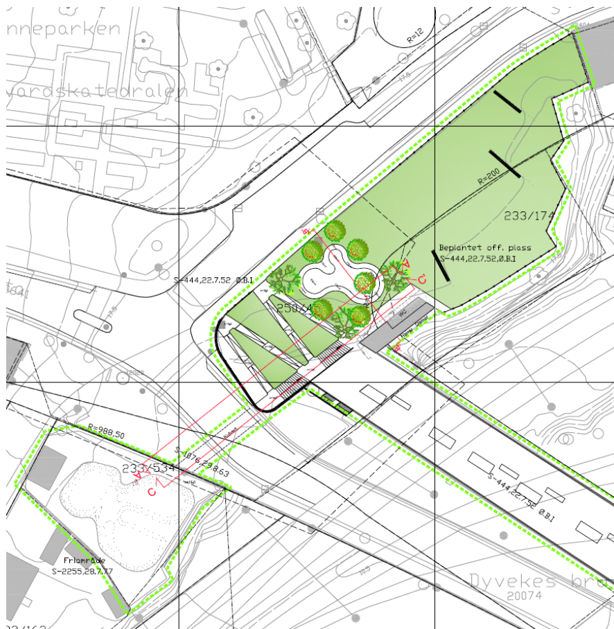
Snitt-tegninger av planlagte tiltak og toalettbygg: