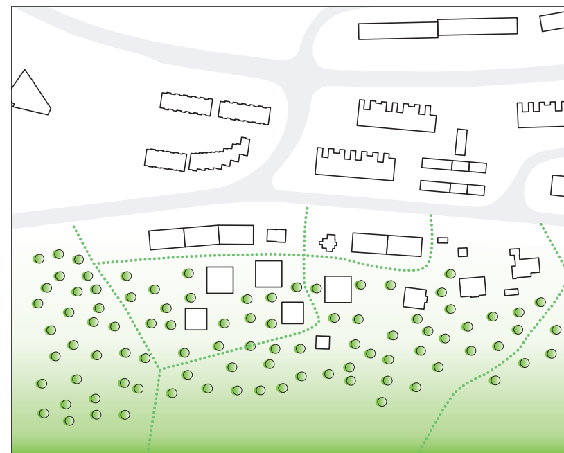
STIENE KNYTTER SAMMEN PROSJEKTET MED OMGIVELSENE