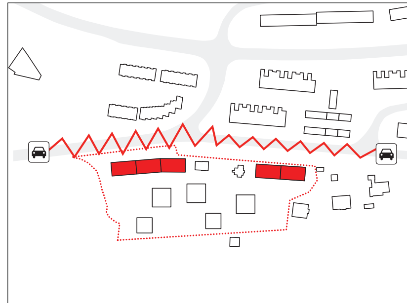
LAMELLER SKJERMER OMRÅDET OG UTEAREAL MOT STØY FRA BILER