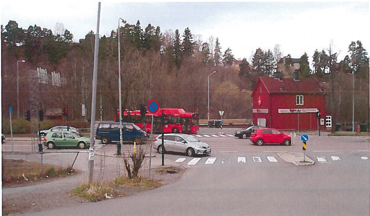
Hauketo – Kollektivknutepunkt, preget av gjennomgangstrafikk

Trafikken i Hauketo – Prinsdal er sterkt preget av gjennomkjøring, spesielt i morgenerushet. Belastningen er størst ved Hauketo stasjon der trafikken fra syd for Oslo gjennom Prinsdal via Nedre Prinsdals vei møter den tverrgående biltrafikken fra E18 via Ljabrudiaagonalen til E6. Trafikken her økte betydelig da Herregårdskrysset i Bydel Nordstrand ble stengt for gjennomkjøring med bom i morgenerushet for noen år tilbake.