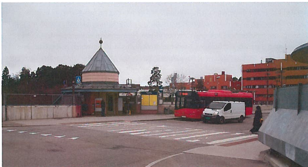
Holmlia kollektivterminal – Overgang buss og tog – Uttrykt bekymring for trafiksikkerheten

Busstilbudet er forbedret de siste årene. Det er kommet flere kommentarer knyttet til oppgradering av bussholdeplasser. Det bør sees på, om det er mulig å få til flere skur og benker på holdeplassene langs sentrale linjer som 76, 77, 79 og 80 bussene. Informasjonstavler for avgangstider finnes hittil få steder i bydelen. Når det gjelder kollektivterminalen på Holmlia er det gjennom innspill uttrykt bekymring for trafiksikkerheten til de som ferdes til og fra bussene som står oppstilt der.