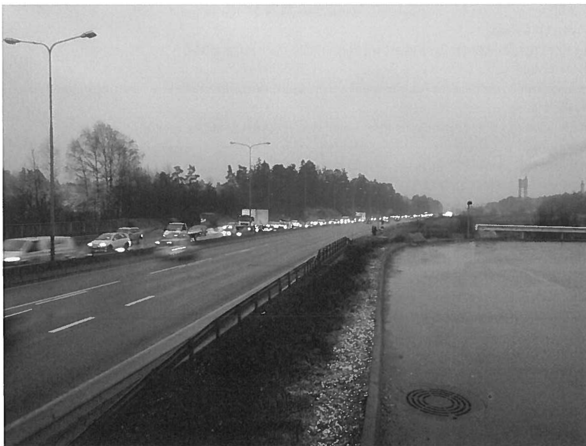
E6 ved Mortensrud– Kø i morgenerushet mot Oslo

Hovedveiene ligger tilnærmet i retning nord-sør. Foruten E 18 og E6 dreier dette seg om Nedre Prinsdals vei som også leder trafikk fra Kolbotn videre ut på E6, E18 eller over Nordstrandplatået gjennom Hauketo krysset. De tverrgående veiforbindelsene ivaretas med Ljabrudiagonalen, Ljabruveien/Enebakkveien og Mortensrudveien. Staten har gjort et bevisst valg på Vinterbro ved å sluse trafikken bort fra Mosseveien/E18 og inn på Europaveien/E6. Dette har medført at det ofte i rushtiden er langsomtgående kø fra utløpet av Nøstvet- tunellen/Assurtjern- krysset og inn til Ryen.