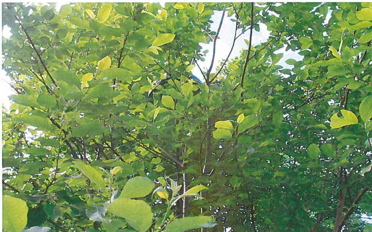
Gjengrodd belysning på gang- og sykkelvei i bydelen

tilrettelegge for økt bruk av sykkel som fremkomstmiddel. Dette, og andre tiltak som for eksempel sykkelteiler, vil til sammen gi et tydelig signal om at sykling er en ønsket aktivitet.