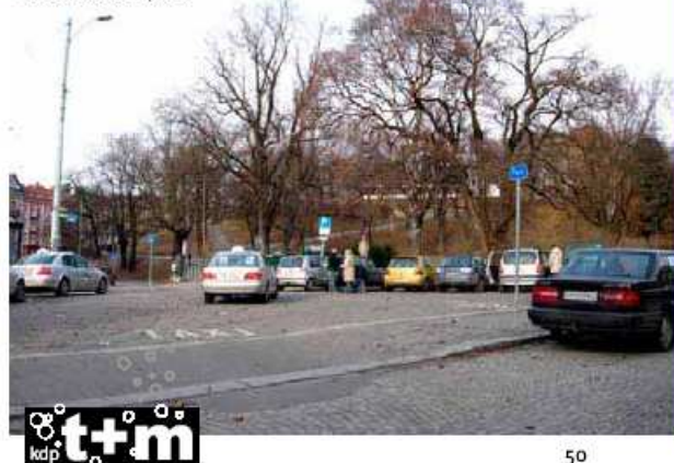
Knud Knudsens plass

De to store sykehusområdene Lovisenberg og Ullevål mangler tilrettelagte allment tilgjengelige tilgjengelige møtesteder. Det er få aktivitetsområder for barn og unge syd i bydelen.