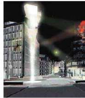
Forprosjekt St. Olavs plass

Ved utvikling av "Folkehelse" er det planlagt et torg som kan gi Lovisenbergområdet en offentlig tilgjengelig plass.