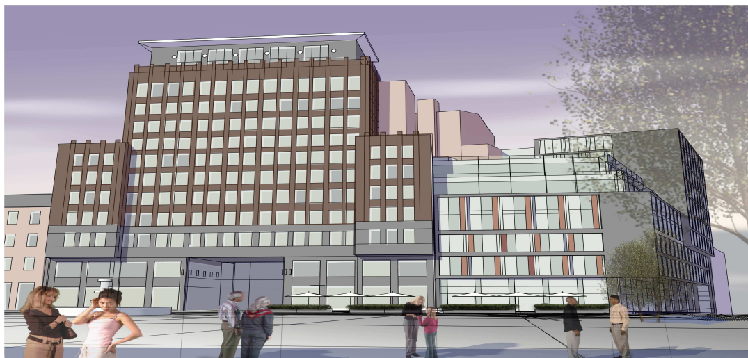
Figur 2 Perspektiv fra torget