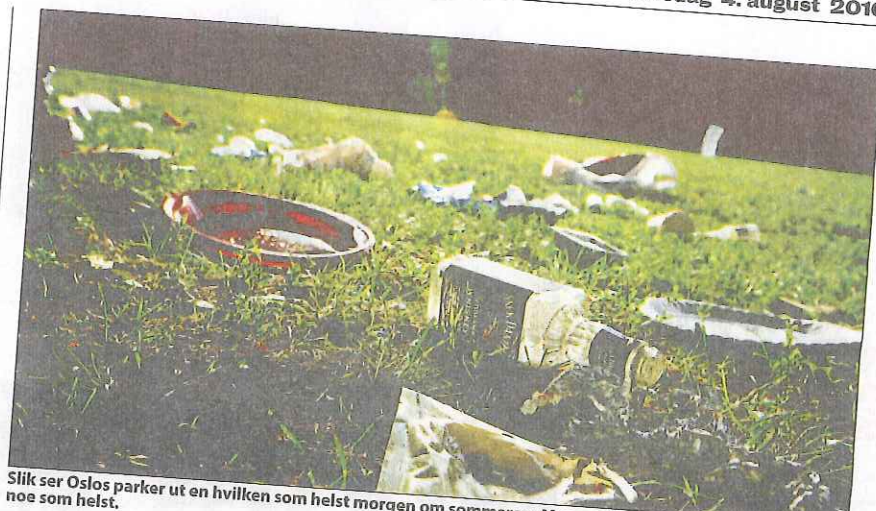
Slik ser Oslos parker ut en hvilken som helst morgen om sommeren. Mange går fra kalaset sitt uten å rydde noe som helst.

«Det finnes ikke allment kjente planer for hva som skal fylle de fraflyttede lokalene»