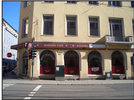
Massawa, på hjørnet av Dronningens gate og Prinsens gate.