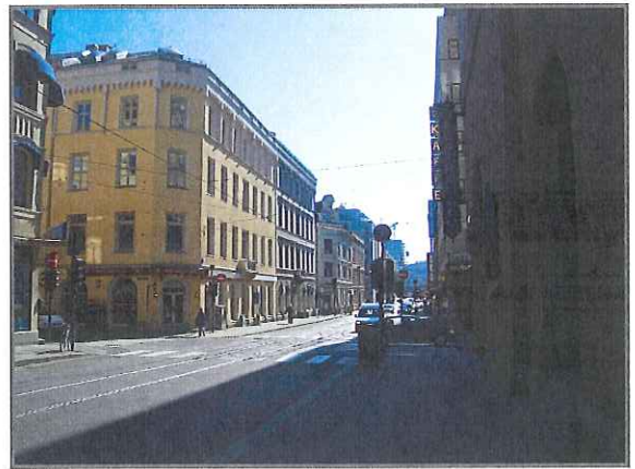
Massawa, på hjørnet av Prinsens gate og Dronningens gate. Posthallen til høyre.