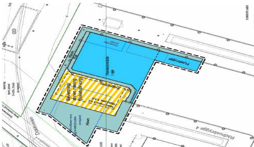
Snitt fra plankart Alt 2

Alternativ 2 er tilsvarende alternativ 1, med unntak av plasseringen som er vist nærmere bryggekannten, og at uteservering her dermed må utgå. Mulighet til uteservering reduseres dermed til mindre arealer inntil bygningen mot vest.