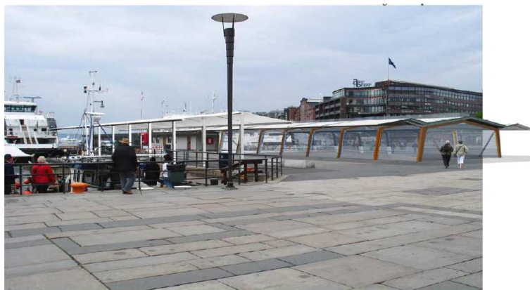
9.12 Fiskehallen- sett fra Rådhusplassen mot Aker Brygge