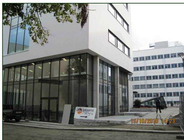
Folkets Cafeconcept; fasaden sett fra Hjalmar Larsens