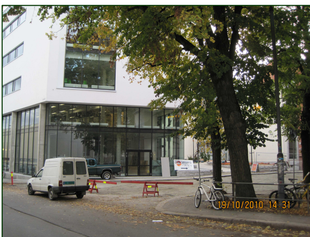
Folkets Cafeconcept; glassfasaden sett fra Bislettgata.