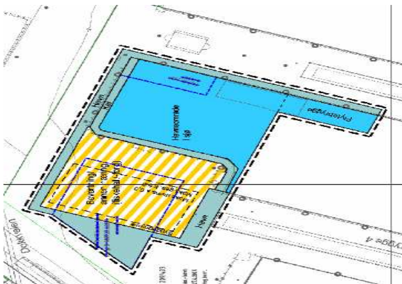
Snitt fra plankart Alt 1

Planområdet reguleres til kombinert bebyggelse og anleggsformål – bevertning/ annen næring (fiskehall/- torg), samferdselsanlegg og teknisk infrastruktur – havn/ kai og bruk og vern av sjø og vassdrag med tilhørende strandsone – havneområde i sjø.