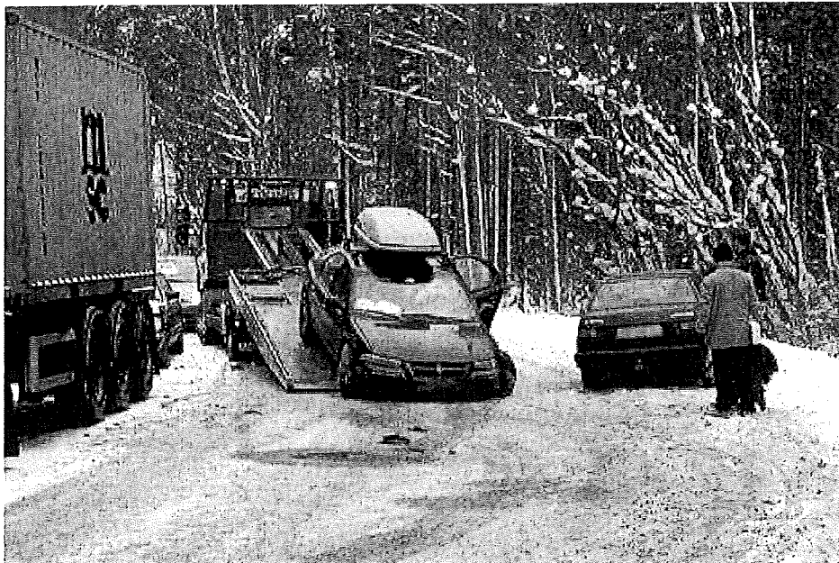
Nordstrand blad 18.1.2010

Mellom de nevnte fotgjengerovergangene er den en sving. Fotgjengerovergangene er ferdselsårer mellom Hallagerbakken og Holmlia senter. Det er fortau på den ene siden av veien. Sving og parkering av store kjøretøyer hindrer utsikt slik det er i dag. Kjøretøyene parker på den siden av veien hvor det ikke er fortau. I tillegg er det skog inntil veien. Hvis en bil møter buss må en av dem kjøre opp på fortauet. Selv med 30 km grense kan det være vanskelig å stoppe i tide, særlig på vinterføre. Farlige situasjoner oppstår. For vel ett år siden kjørte en buss i grøfta, og 17. januar var det også en bilulykke i nevnte sving (illustrasjon fra Nordstrand blad). Det er etablert parkeringsforbud i sving i øvre del av Ravnåsveien. Det bør på lignende måte bli parkeringsforbud også mellom fotgjengerovergangene i nedre del av Ravnåsveien.